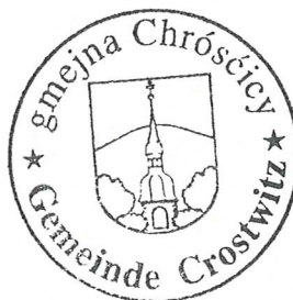
Marko Kliman wjesnjanosta

Gmejska rada gmejny Chrósćicy přihtosuje nad planowym wudawkam we wysokosći 20.000 € za předewzaće "Wutworjenje centralneje móžnosće zetkawanja a wočerstwjenja w Chrósćicach, Při pastyrni 5" w zwisku z předewzaćom "Wobnowjenje hrajkanišća a připrawjenje městnosće za grilowanje".