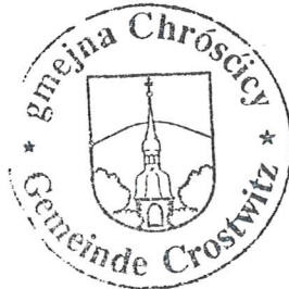
Marko Kliman wjesnjanosta

Gmejnska rada gmejny Chrósćicy přihłosuje přiwzaću zwonka planowych dochodow z pjenježneho myta wubědźowanja Simul+ za wjesny rum we wysokosći 250.000 eurow.