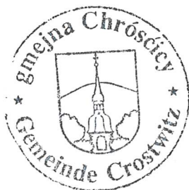
Marko Kliman wjesnjanosta

Gmejska rada gmejny Chrósćicy wobzamkne, nadawk za wuhotowanje rumnosće ručneho džěla w Serbskej zakładnej šuli w Chrósćicach firmje Pětr Just, Serbske Pazlicy, Cyrkwinska hasa 2 b, 01920 Njebjelčicy, z hospodarsce najlěpšim poskitkom we wysokosći 7.665,98 € brutto přepodać.